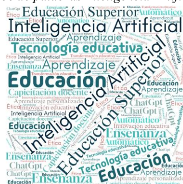
Figura 3. Nube de palabras Inteligencia Artificial en Educación.

Nota: Elaboración propia basado en el análisis de palabras claves de las investigaciones sobre IA en educación 2020-2025