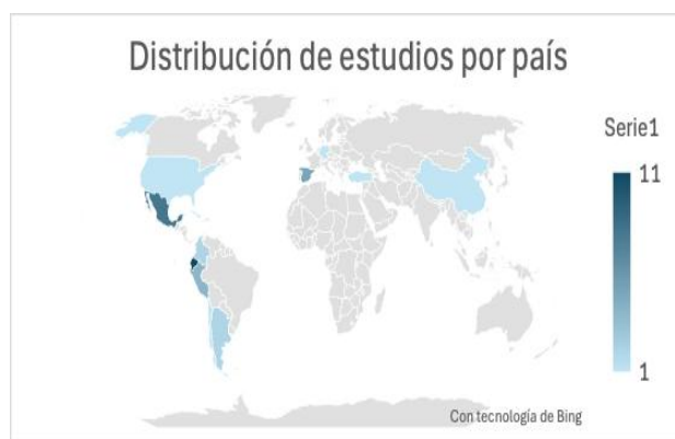
Figura 2. Mapa de distribución de estudios por País.

Nota: Elaboración propia basada en el análisis bibliométrico de los artículos recopilados.