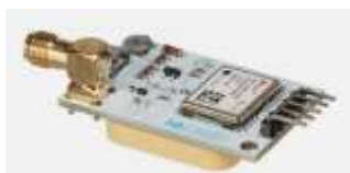
Imagen 1. Módulo GPS Velleman VMA430 U-BLOX Neo-7M para Arduino,

El dispositivo utilizado como prototipo, que permite establecer la conexión entre los indicadores del vehículo y la app móvil, es el Arduino. El Arduino es una plataforma de desarrollo basada en una placa electrónica de hardware libre que incorpora un microcontrolador re-programable y una serie de pines hembra que permiten establecer conexiones entre el microcontrolador y los diferentes sensores y actuadores de una manera muy sencilla (MCI Electronics, 2024). Algunos de los tipos más utilizados son modelo Uno, Leonardo, Mega Nano y ProMini, entre otras. A estas placas se le puede conectar diferentes módulos, entre ellos módulos que permiten la comunicación GPS por medio de chip telefónico. Estos módulos permiten diferentes protocolos de comunicación y así establecer una comunicación con un dispositivo móvil por Bluetooth, Wifi, Infrarrojo, etc. Algunos de los módulos en el mercado que pueden interactuar con la placa Arduino son: Módulo GPS Velleman VMA430 U-BLOX Neo-7M para Arduino, Módulo satelital de posicionamiento GPS micro USB NEO-6M/NEO 7M para Arduino, Mini módulo de posicionamiento satelital GPS NEO-7M/NEO-6M 51 para Arduino STM32, SIM808: GSM/GPRS+GPS.