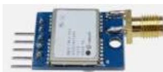
Imagen 2. Mini módulo de posicionamiento satelital GPS NEO-7M/NEO-6M 51 para Arduino

APIS's de Servicio de Google Play: La API de Geolocalización es un servicio que acepta una solicitud HTTPS con la torre de telefonía celular y puntos de acceso wifi que un cliente móvil puede detectar. Muestra coordenadas de latitud y longitud y un radio que indique la precisión del resultado para cada entrada válida (Google for Developers, 2024). Esta API fue utilizada para obtener ubicación GPS y mapa