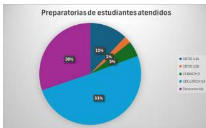
Figura 4. Planteles de preparatoria atendidos.

Durante el semestre enero–junio 2025, el proyecto atendió a un total de 182 estudiantes provenientes de diversas instituciones con convenio vigente con el ITCJ. La mayor participación correspondió al CECyTECH 14, con 92 estudiantes atendidos, seguido por el CBTIS 114 con 22, el COBACH 5 con 9 y el CBTIS 128 con 4, mientras que 55 estudiantes no registraron su plantel de procedencia. De los 57 jóvenes que finalmente ingresaron al ITCJ, 19 provenían del CECyTECH 14, 9 del CBTIS 114, 4 del COBACH 5, 3 del CBTIS 128 y 22 no especificaron su origen, como se observa en la Fig. 4.