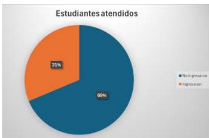
Figura 1. Estudiantes atendidos en el programa.

Durante el semestre enero–junio 2025 se atendió a un total de 182 estudiantes de bachillerato, de los cuales 57 lograron ingresar al ITCJ, lo que representa una tasa de conversión del 31.32%, como se observa en la Figura 1. Este dato es relevante, ya que indica que aproximadamente uno de cada tres estudiantes atendidos decidió continuar su trayectoria académica en el instituto, reflejando el impacto positivo de las acciones de orientación y acompañamiento implementadas.