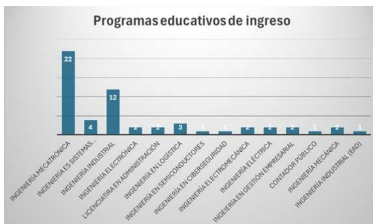
Figura 3. Programas educativos en el ITCJ.

En la Figura 3 se observan los programas con registró de ingresos más reducidos, entre 1 y 3 estudiantes por carrera, destacando Ingeniería en Logística (IL) con 3, así como Ingeniería en Gestión Empresarial, Ingeniería Eléctrica, Ingeniería en Electrónica y otras disciplinas con 2 ingresos cada una. Aunque estas cifras son menores, reflejan un interés diversificado de los estudiantes en distintas áreas del conocimiento, lo que fortalece la multidisciplinariedad del ITCJ.