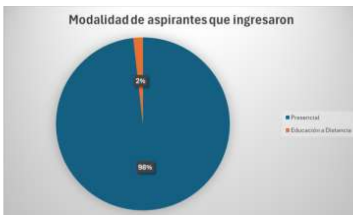
Figura 6. Modalidad de aspirantes que ingresaron al ITCJ.

En conjunto, los resultados obtenidos confirman que “ITCJ Diseñando tu Futuro” es una iniciativa con alto potencial de crecimiento e impacto educativo. Consolidar este proyecto como una acción permanente permitirá al ITCJ no solo atraer a estudiantes mejor preparados y vocacionalmente orientados, sino también reafirmar su compromiso social con la formación de jóvenes competentes, críticos y comprometidos con el desarrollo científico y tecnológico de la región, como se observa en la Figura 6.